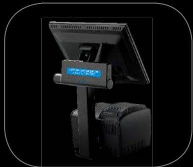
Staffa e display cliente

La più avanzata tecnologia IT nel mercato del Retail!