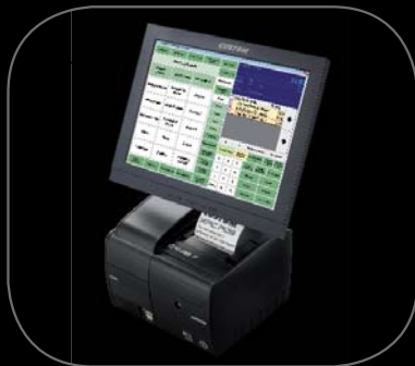
Disponibile con monitor touch operatore 12" o 15"