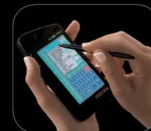
Terminali per radio comande per sistema di cassa XPC POS con software ECR CUSTOM