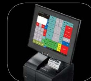
XPC POS F con software ECR CUSTOM