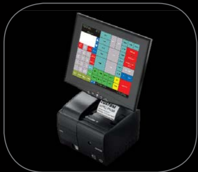
Versione con software ECR CUSTOM